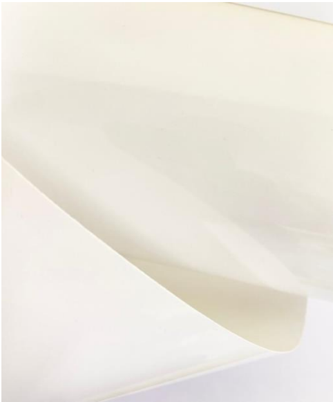
Photo Brilho SM860