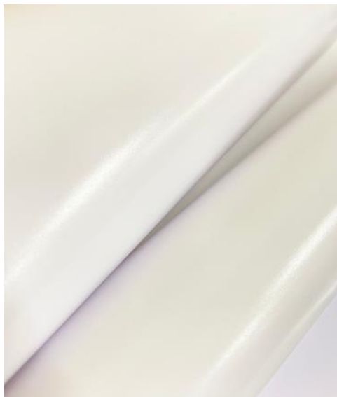
Photo Satin SM810